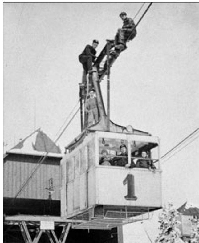
První československá lanovka vedla od roku 1928 na Černou horu v Janských Lázních.