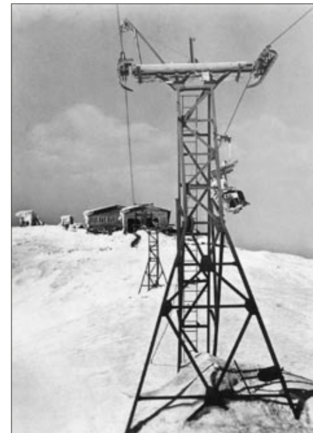
Sedačková lanovka jezdí z Pece směrem na Sněžku nepřetržitě 55 let.

Nevěříte tomu? Já se nedivím, asi to bylo úplně jinak. Medvěd je totiž vycpaný. Dlouho postával ve vrchlabském zámku, snad uloven místními pány z rodu Czernin-Morzinů. V roce 1940 se přestěhoval do zámku v Horním Maršově, kde byl v roce 1945 dekretem prezidenta republiky znárodněn. Nevěděl kam jít, tak se schoval do kabinetu přírodopisu v maršovské škole. Vcelku se nudil, jen na mejdanech učitelů při vánočních besídkách a na konci školního roku si užíval. To koukal skleněnými očima! Někdy mu dali i napít nebo potáhnout ze zapálené cigarety. Jenže potom zase šup na půl roku zpátky mezi vycpaniny. Vše se změnilo s příchodem