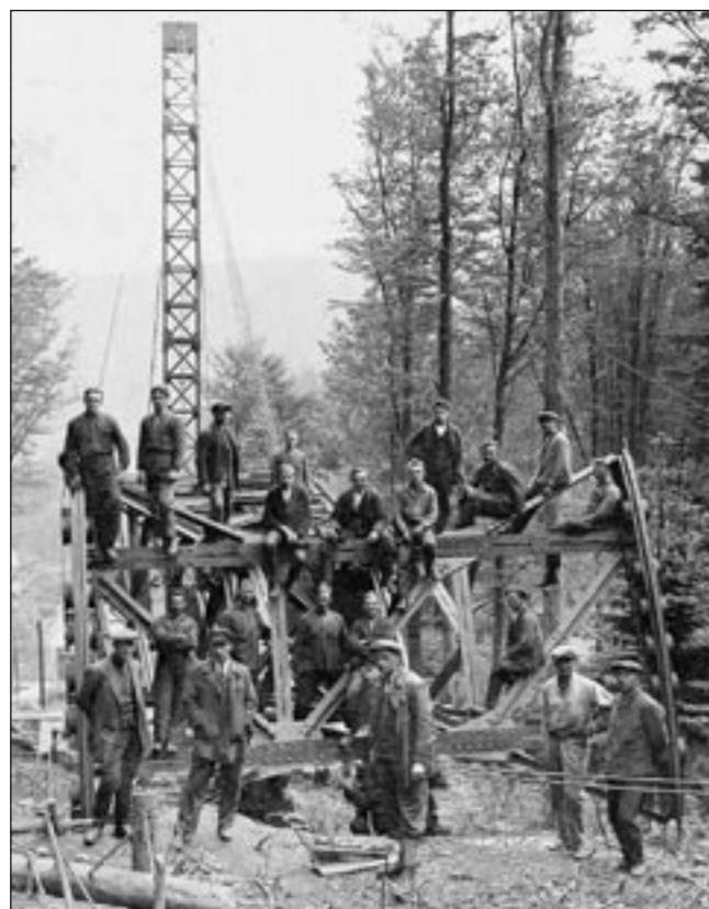
Odhodlaní stavitelé lanovky na Černou horu.