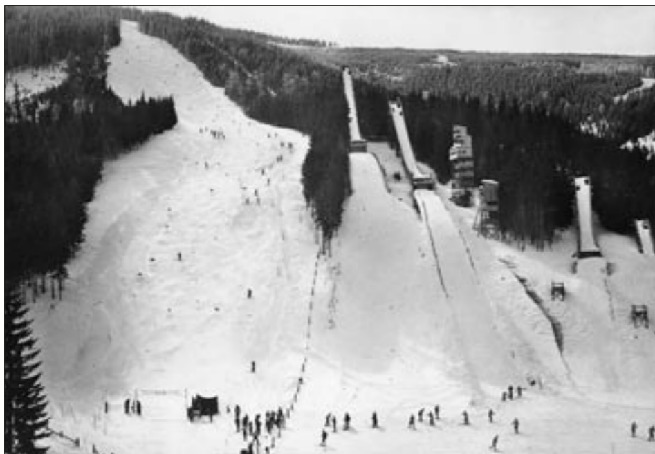
Čtyři lyžařské můstky s kritickým bodem 16, 28, 50 a 72 metrů byly vedle slalomového svahu na černé sjezdovce až do roku 1980 nejvýraznější částí „Zimního stadionu Svatý Petr“. Fotografie Zdenka Mence je asi z roku 1960.