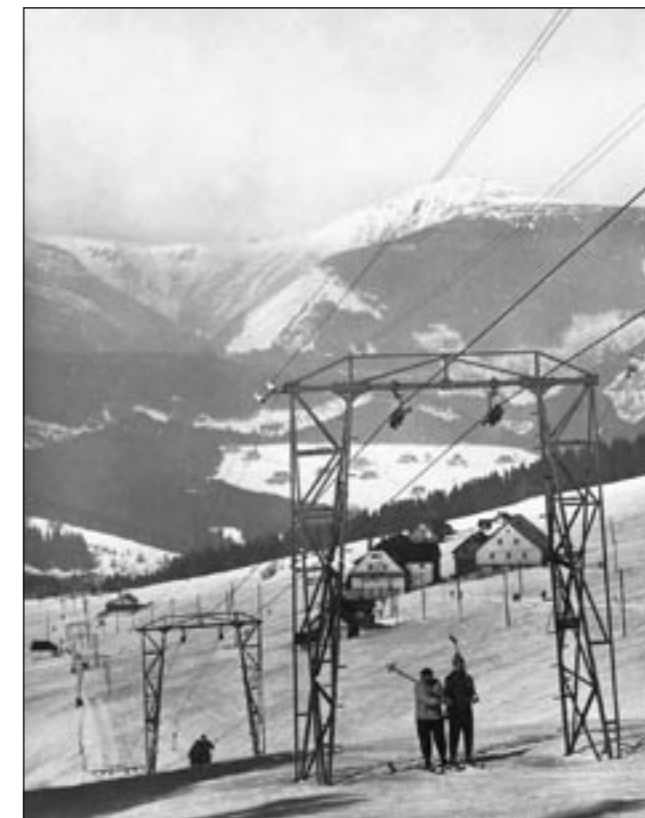
Fotografii z roku 1959 by tehdejší lyžař popsal jako pohled od Bobích luk přes Muldu k Bramberku.

Bodenwiesenbauden nebo také v místním dialektu Bohnwiesbauden (boudy na luční půdě) si ještě za Rakouska čeští turisté a lyžaři zkrátili na Bodenvisky. Později z toho byly Bobí louky. Přitom původní pojmenování odráželo založení luční enklávy na vysoko položeném hřebeni, žádné boby k jídlu ani boby pro jízdu ledovým korytem s místem nesouvisejí. Dnešní název Lučiny odpovídá nejstaršímu jménu, ale naši rodiče a prarodiče neřeknou jinak, než „tam na Bo-