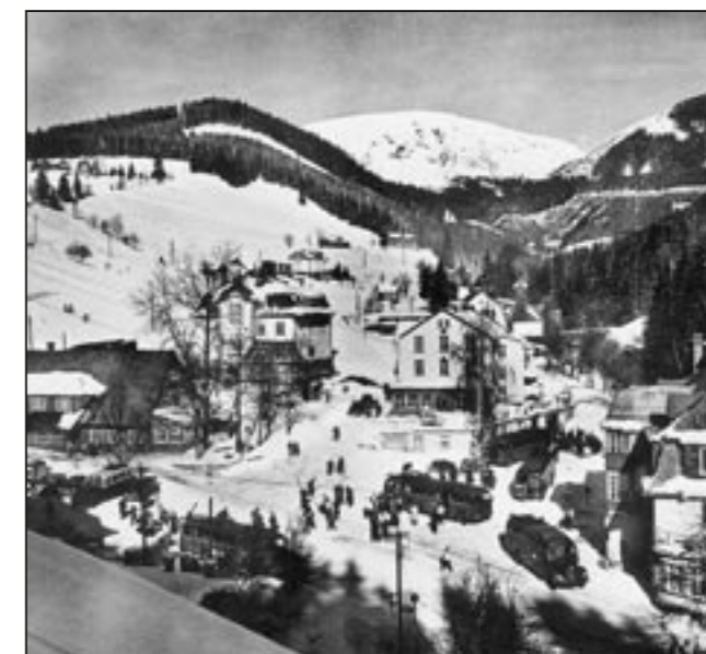
V úzkém údolí byly v Peci vždy problémy s parkováním neukázněných řidičů. Autobusy dokázaly ucpat hlavní silnici už v 60. letech. Vozidla odstavená mimo určená místa brání provozu a čištění sněhem zapadáných komunikací. V Peci pod Sněžkou nově působí i Městská policie Trutnov a strážníci bedlivě sledují špatné parkování vozů.

O. K. Služby Pec pod Sněžkou, ředitel Jiří Šteiner, tel. 499 736308, fax 499 896159, parkovací služby, nákladní doprava, prodej známek na popelnice a plastových pytlů na komunální odpad.